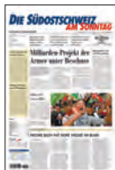
1. BUND Region

«Chili» erscheint jeden Sonntag als 4. Bund zur Sonntagsausgabe der «Südschweiz». Es werden Trends im Bereich Leben, Wohnen, Essen und Trinken, Mode, Schönheit und Reisen besprochen und kommentiert. Prominente Gastautoren sorgen für Exklusivität, Kompetenz und Glaubwürdigkeit. Edel gestaltet und gut lesbar bietet «Chili» ein ideales Umfeld für gehobene Markenwerbung.