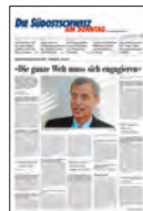
2. BUND Inland Ausland Kultur