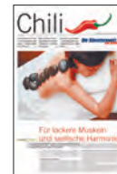
4. BUND Lifestyle